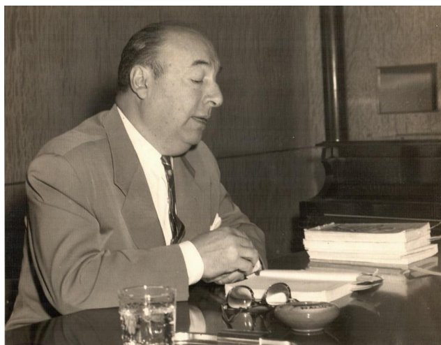
Figura 1. El poeta chileno Pablo Neruda ofreció recital de poesía en la Biblioteca Nacional José Martí, el 13 de diciembre de 1960.

Entre las personalidades extranjeras estuvieron el escritor guatemalteco Miguel Ángel Asturias, el mexicano Carlos Fuentes y el francés Roger Caillois, quienes ofrecieron conferencias e inauguraron la serie “Autores en la Biblioteca Nacional”. Dicho año cerró con el magistral recital de poesía del poeta chileno Pablo Neruda, el 13 de diciembre de 1960, otro memorable acontecimiento que quedó estampado en la memoria gráfica de la institución como se observa en la figura 1.