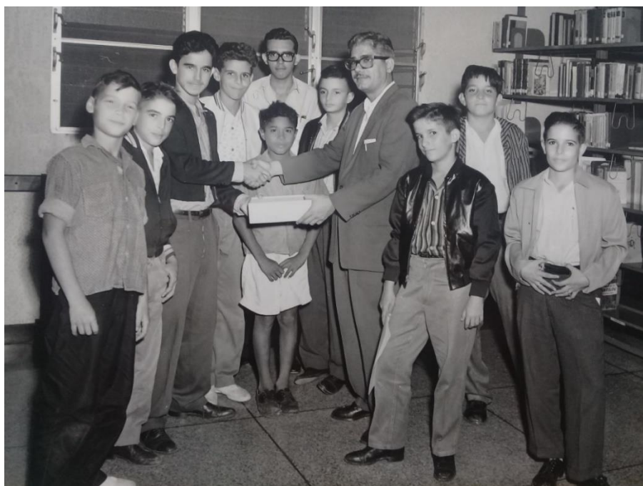
Figura 4. Entrega de premio en torneo de ajedrez con los usuarios de la Sala Infantil y Juvenil, noviembre de 1962.