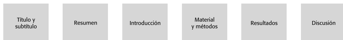
Figura 1. Estructura de la redacción científica.

Esta organización IMMRyD facilita la comunicación del autor con el lector, porque este último sabe dónde encontrar rápidamente cualesquiera de las partes, así como el contenido correspondiente a cada una de ellas, debido a que los trabajos científicos