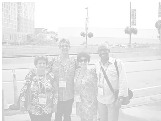
Figura 1. Miembros de la delegación cubana al evento.

La delegación cubana que asistió a la 82 Conferencia General y Congreso de IFLA —que en esta oportunidad estuvo integrada por un grupo de valiosos profesionales representando diferentes tipos de bibliotecas, lo que permitió un balance profesional y poder asumir varias funciones—, tuvo a su cargo también la presentación de los siete posters que fueron aprobados y expuestos durante el cónclave.