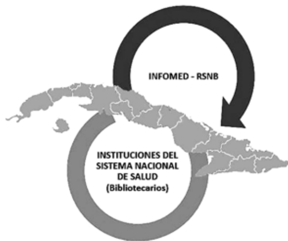
Figura 4. Esquema de propuesta de la primera Red Social Nacional para Bibliotecarios cubanos.

Luego de esta valoración ya se realiza trabajo de mesa (con propuesta de plantilla web) por parte de especialistas de la BMN. (Figura 5).