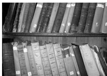
Figura 2. Almacenamiento de la documentación en el archivo.

Afectaciones en los documentos: existencia de documentos con desgaste, perforación, oxidación, manchas, arrugas y/o dobleces, etc. Falta de detectores contra incendios. Falta de instrumentos de medición como luxómetros, termómetros, sicrómetro entre otros. Para el diagnóstico del fondo se utilizaron los inventarios realizados para el museo municipal y para la propia institución. Se tomaron como muestra todos los documentos que atesora el archivo por no