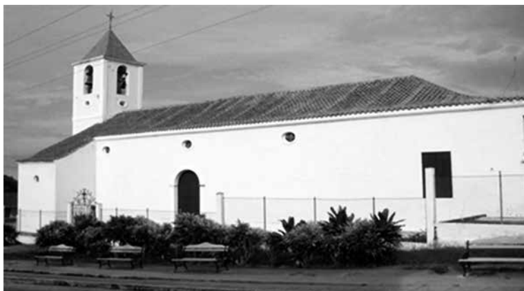
Figura 1. Vista lateral de la Iglesia Católica “San Pedro y San Pablo” de Corralillo. (fuente: elaboración propia).

El archivo se encuentra enclavado en el poblado de Corralillo de la Provincia de Villa Clara. La institución está localizada dentro de la Casa Parroquial de la Iglesia Católica “San Pedro y San Pablo”. La iglesia se encuentra ubicada en el centro de la manzana que rodean las calles Leoncio Vidal, Libertad, Rafael Izquierdo y Máximo Gómez. La edificación es considerada Patrimonio Local, posee una estructura de planta rectangular, presenta una sola puerta en su fachada principal la cual está presidida por tres arcos de medio punto de alto puntal en sus caras exteriores que soportan la torre, a la cual le siguen dos cuerpos cúbicos de forma decreciente y termina en una cupulilla de forma piramidal. La cubierta es de tejas criollas sobre un afaldaje de madera a dos aguas. Los muros son de mampostería utilizando fundamentalmente la piedra, el ladrillo y el cocó como material aglomerante. En el piso se utilizó el mosaico mezclado con el hormigón natural. La construcción data de la segunda mitad del siglo XIX. Fue inaugurada en febrero de 1853. Mantiene buen estado constructivo y sin peligro de derrumbe.